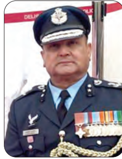
Air Commodore Ashutosh Ji